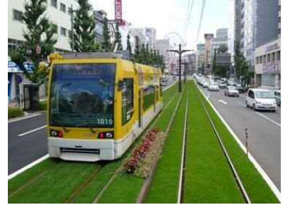
軽量シラス基盤の施工例