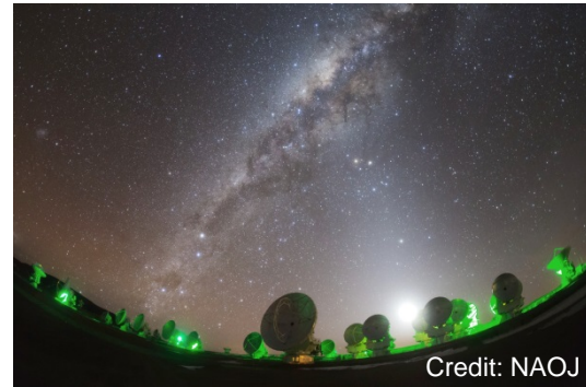
▲標高5000m超の砂漠に位置する巨大施設ALMA